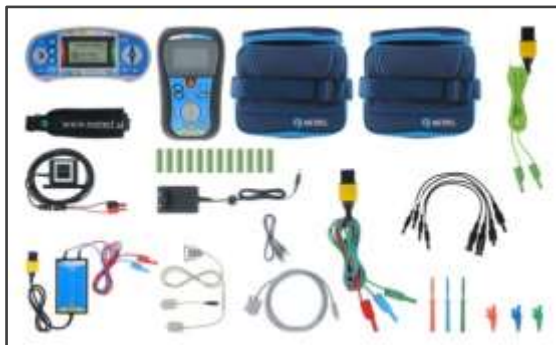
MI 3109 PS